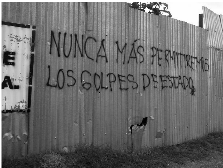
Pintada en una calle de Tegucigalpa (Honduras).

Durante estos últimos 2 meses, la actitud del gobierno español y de toda la comunidad internacional ha sido firme, condenando en repetidas ocasiones el