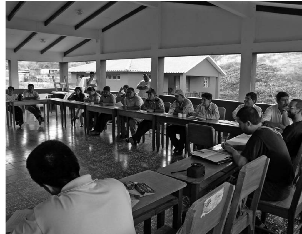
Las ONG aportan una experiencia en cooperación con las poblaciones que generalmente las empresas no poseen.

Entre estas dos conductas extremas, la Responsabilidad Social Corporativa (RSC) permite otro tipo de colaboración. La RSC puede definirse como la integración voluntaria, por parte de las empresas, de las preocupaciones sociales