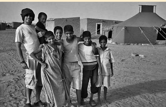
Campamento de refugiados saharais en Tindouf (Argelia).

Ingeniería Sin Fronteras Asturias y Galicia trabajan en el proyecto Aqua-Sahara que pretende fortalecer la formación técnica del personal de Hidráulica de la República Árabe Saharaui Democrática (R.A.S.D.) encargado de las labores de gestión y abastecimiento de agua. A finales de año se impartirán cursos de administración, calidad de agua, informática y gestión de almacenes. La actuación de Ingeniería Sin Fronteras se enmarca dentro del objetivo global del Proyecto para el Abastecimiento de agua a los campamentos de refugiados Saharais en Tindouf, en marcha desde el año 2001. www.isf.es