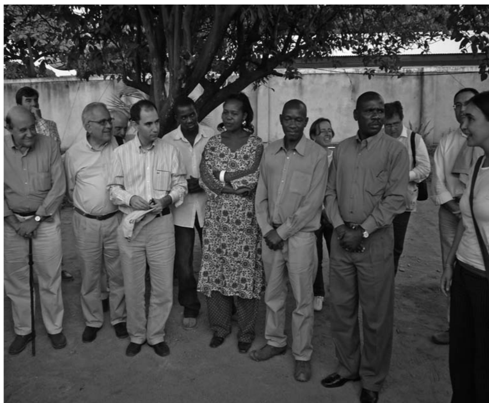
El equipo local de ISF ApD y autoridades locales reciben a parte de la delegación que viajó a Tanzania para conocer sobre el terreno el programa hidrosanitario de Kigoma.

Pero ¿cómo puede construirse en sentido práctico la relación entre Organizaciones No Gubernamentales para el Desarrollo y empresas? Únicamente desde el conocimiento mutuo, sobre la confianza y con corresponsabilidad.