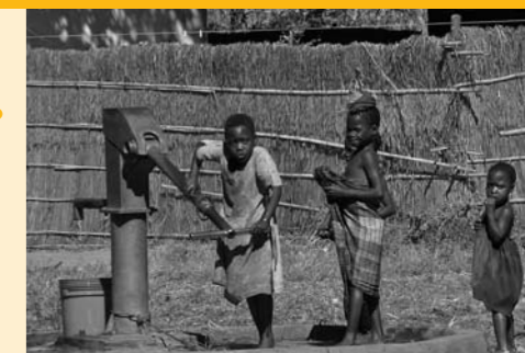
En Mozambique, el 57% de la población no tiene acceso sostenible al agua (PNUD 2006).